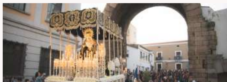
la concatedral de Santa María.

Más de 50 profesionales llegarán a la ciudad el próximo lunes 3 de abril para comenzar con las tareas de montaje de todo el recorrido desde el que se emitirán las procesiones. En concreto, el tramo desde el que se va a retransmitir será la calle Trajano, Santa Julia y Plaza de España hasta