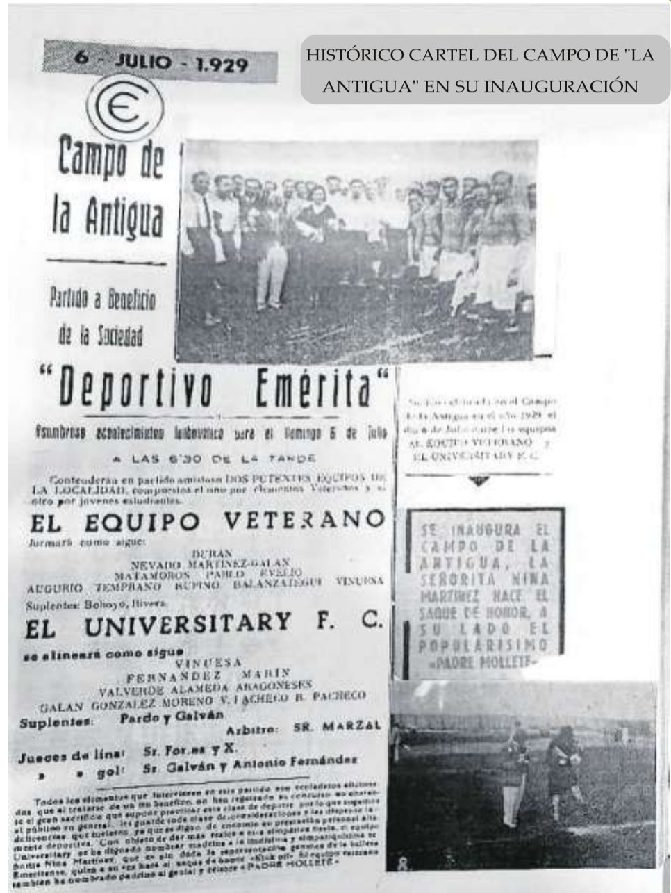
HISTÓRICO CARTEL DEL CAMPO DE "LA ANTIGUA" EN SU INAUGURACIÓN