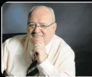
Félix Pinero Periodista y escritor